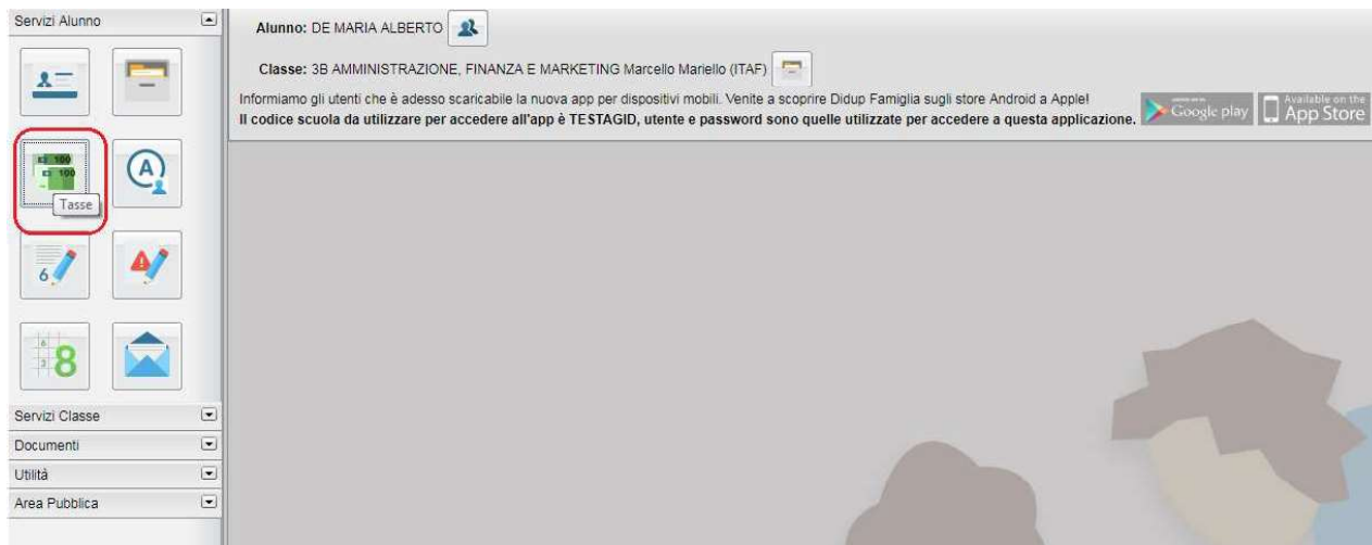
(accesso ai servizi di pagamento)

Il servizio di pagamento delle tasse e dei contributi scolastici è integrato all'interno di Scuolanext - Famiglia, ed è richiamabile tramite il menù dei Servizi dell'Alunno .